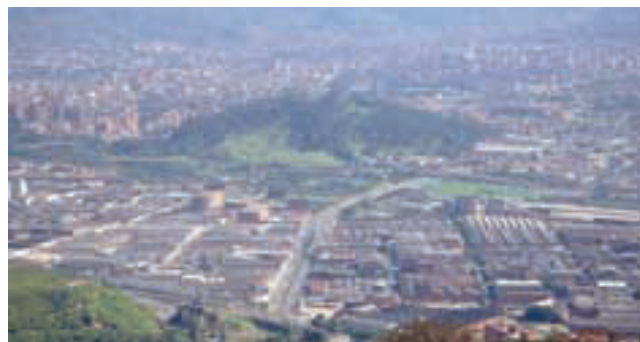
Medellín, es un ejemplo de la conurbación, debido al proceso de expansión urbana sobre el Valle de Aburrá.

Sobre la cordillera Central, al norte, se encuentra el eje cafetero, conformado durante la colonización antioqueña; en la parte central, la región caucana, cuyo centro está en el Valle del Cauca; y al sur, el altiplano nariñense, con un poblamiento más antiguo y rural. El valle alto y medio del río Magdalena introduce una relativa ruptura en el bloque andino, por sus condiciones climáticas y productivas, es una zona de colonización y poblamiento acelerado donde se destacan por su volumen poblacional, el Tolima y el sur del Huila.